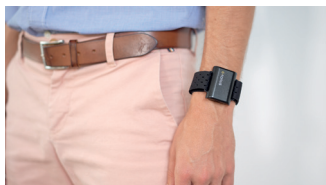
Avec le bras opposé, enfiler E-TONUS de la main et positionnez-le sur la face dorsale du poignet.

Avant la pose de E-TONUS, la zone sélectionnée doit être dénudée et dépourvue de tatouage sous E-TONUS.