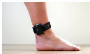
Avec vos deux mains, enfiler E-TONUS et positionnez-le entre le tendon d'Achille et l'extérieure de la jambe.

Ajuster le bracelet pour permettre le maintien. En cas de difficulté, se faire aider par une personne de confiance ou un professionnel de santé.