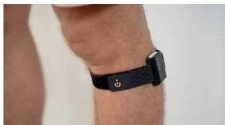
Avec vos deux mains, enfiler E-TONUS et positionnez-le sur la face latérale du genou en avant ou en arrière du péroné.