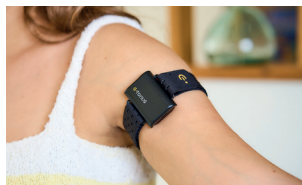
Avec le bras opposé, enfiler E-TONUS de la main jusqu'au-dessus du biceps, en vérifiant que le bouton du E-TONUS est bien orienté vers le haut, donc visible.